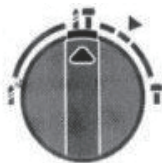
сверление с ударом