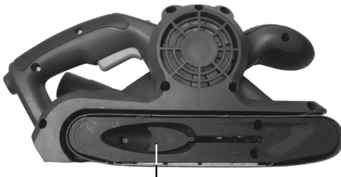
Рычаг натяжения ленты